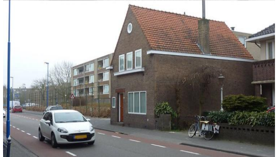
Gasthuisstraat toen en nu met het LeoXiii gebouw

..... Advertentie uit "De Dongenaar" geplaatst in 1950 "nostalgie"